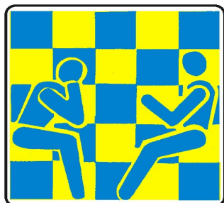
Club 64 Modena